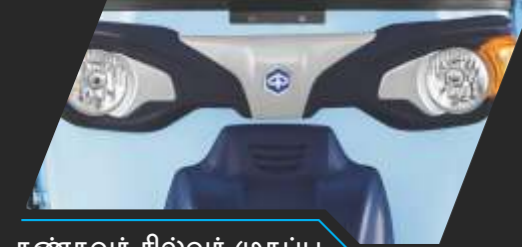
கண்கவர் சில்வர் முகப்பு பேனல்