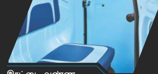
இரட்டை வண்ண இருக்கைகள்